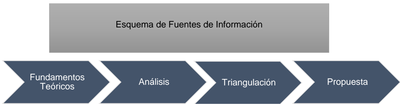
Tabla 3. Esquema de Fuentes de Información

En el capítulo I, se han expuesto los fundamentos teóricos, doctrinales y conceptuales que conforman el marco teórico del presente estudio, los cuales son utilizados como base de referencia para la evaluación efectuada en los guiones de análisis documental. A través de una exhaustiva revisión de los contenidos, se han identificado las categorías de análisis vinculadas con el alcance de los objetivos específicos propuestos para esta investigación, mismos que se detalla a continuación: