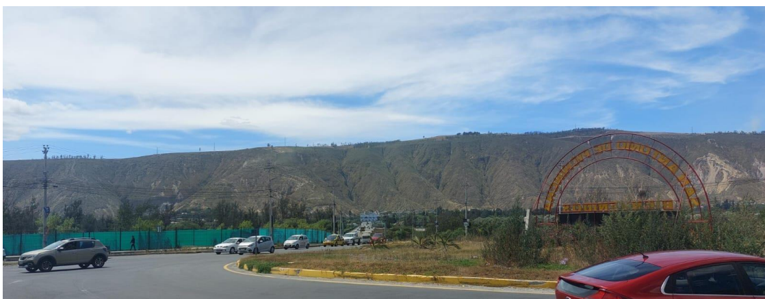
Gráfico 10. Accesibilidad

La accesibilidad en la zona es excelente, con múltiples puntos de acceso disponibles. A pesar de la falta de señalización, hay un redondel bien construido que conecta de manera fluida las diversas redes de carreteras que convergen en esta área. Este redondel se distingue por su óptimo estado de conservación. Además, se observa un tráfico constante y fluido en la zona, lo que indica una accesibilidad excepcional.