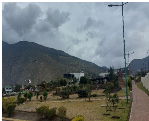
Gráfico 7. Recreación

Este parque desempeña un papel crucial como un espacio de relajación, brindando a las familias viajeras la oportunidad de encontrar un entorno seguro y adecuado para sus hijos. Además de su función de descanso, el parque también sirve como un punto de encuentro, promoviendo interacciones entre los turistas.