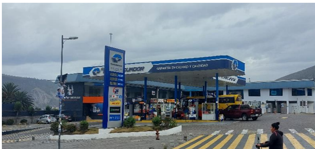
Gráfico 8. Servicios de apoyo

En esta zona, ofrece una amplia gama de servicios para satisfacer todas las necesidades. Uno de los servicios, es la estación de servicio, estratégicamente ubicada para brindar suministros esenciales a los transportistas que llegan a este punto crucial.