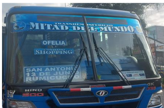
Gráfico 4. Transporte público

Se encuentra disponible un viaje con una duración estimada de 45 minutos que parte desde la estación de autobuses denominada "La Ofelia". El costo del billete para este viaje es de 45 centavos (ctvs.), y el recorrido seguirá la ruta a lo largo de la Avenida Manuel Córdova Galarza.