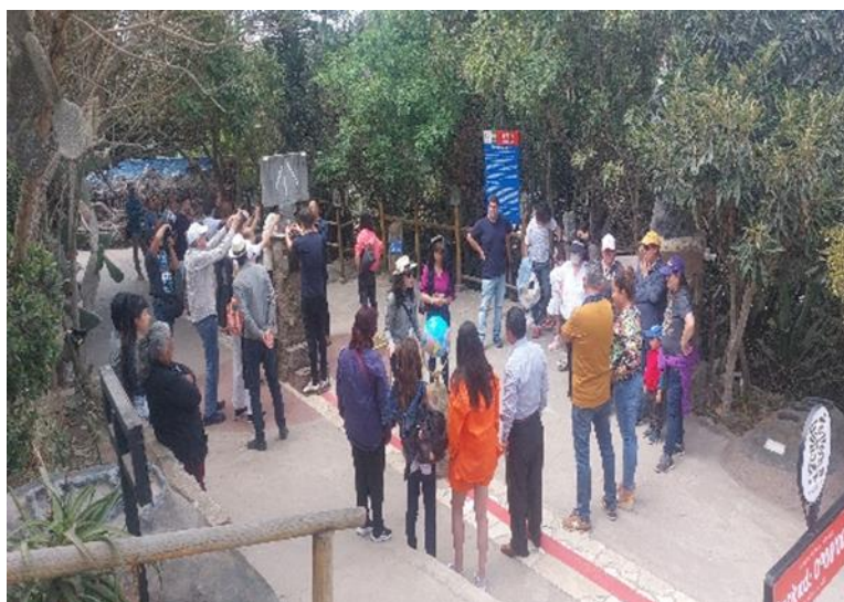
Grafico 12. Demanda

En estos lugares turísticos, hay una diversa demanda de visitantes, tanto nacionales como extranjeros, que disfrutan de diversas experiencias de duración variable. En general, se observa una afluencia constante de grandes grupos, familias, niños y personas mayores. En algunos casos, la presencia de turistas extranjeros es notoria, mientras en otros lados, se diluye con la abrumadora presencia de turistas nacionales. Los visitantes participan en actividades que pueden durar desde aproximadamente una hora y treinta minutos hasta tres horas, y disfrutan de opciones de consumo como helados, platillos y bebidas.