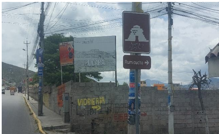
Gráfico 11. Señalética

No se ha identificado una señalización direccional adecuada a lo largo de la parroquia que brinde información o orientación a los visitantes con respecto a la ubicación de Rumicucho. El único letrero que se pudo encontrar está en un estado de deterioro, carece de colores llamativos y muestra signos de falta de mantenimiento.