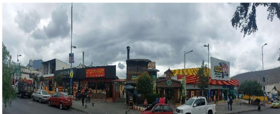
Gráfico 6. Alimentación

A continuación, se proporciona un ejemplo representativo de las opciones disponibles: