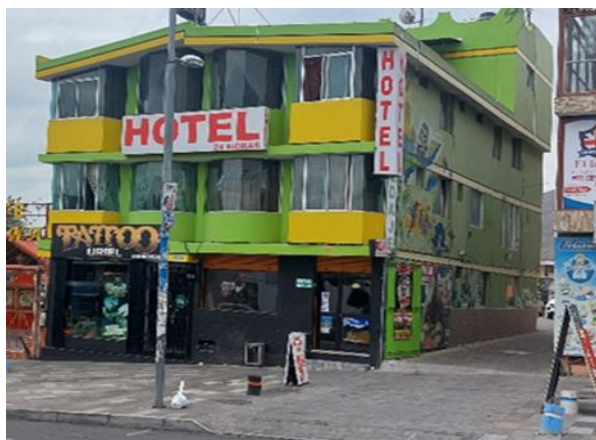
Gráfico 5. Alojamiento

En cuanto a la oferta de hoteles, la mayoría de las opciones disponibles son pequeños establecimientos, tal es el caso del Hotel Inti Raymi. Estos lugares no se caracterizan por ofrecer lujos, sino que más bien cuentan con comodidades básicas y tarifas económicas