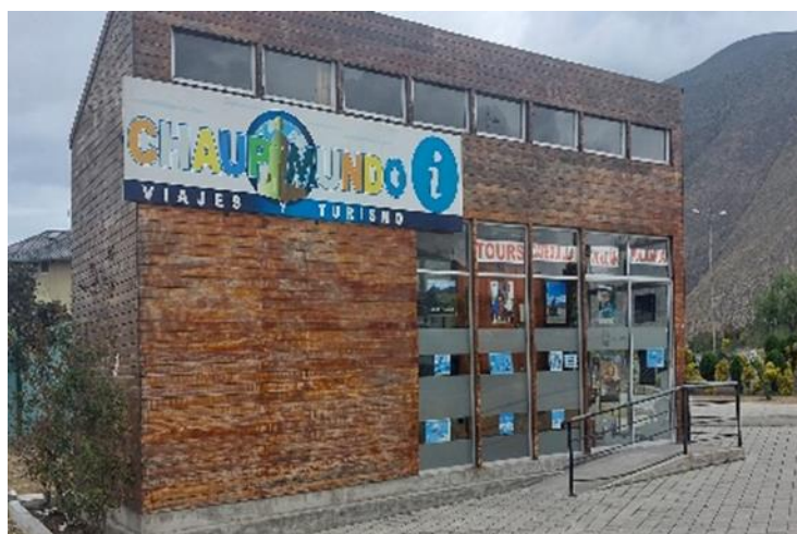
Gráfico 9. Agencia de viaje

"Chaupimundo" se distingue como la agencia de viajes líder en la región, destacándose por ser la única que promociona y ofrece paquetes turísticos que abarcan todos los atractivos del área.