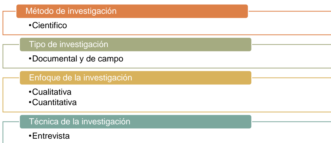
Gráfico 3. Estructura metodológica de la investigación

En consecuencia, en esta sección se presentaron de forma concisa, con algunos aspectos generales de la metodología empleada en el estudio. Con la finalidad de establecer la organización previamente mencionada, resultó necesario el detallar la estructura metodológica utilizada, la cual se describe a continuación en la siguiente figura: