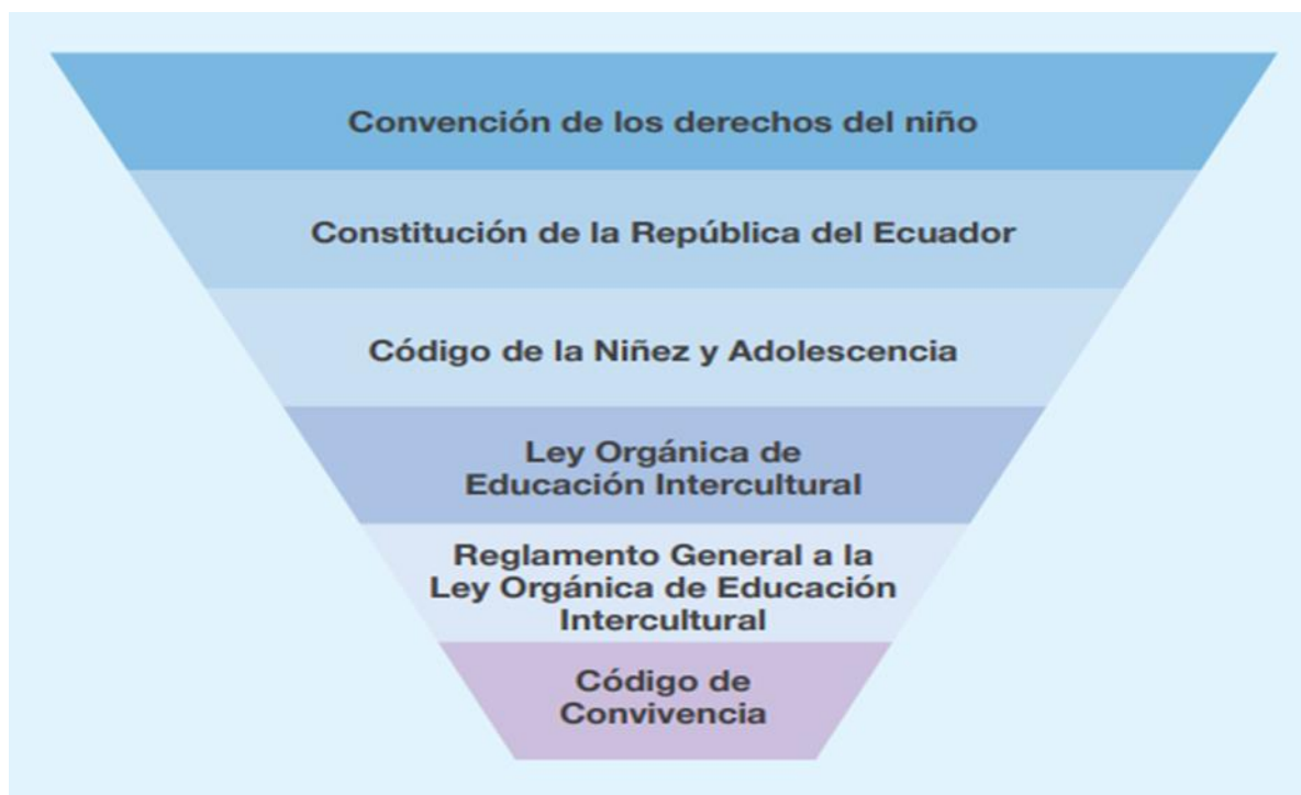
Figura 3. Pirámide de Orden Jerárquica