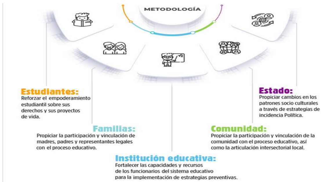
Figura 2. Metodología para la implementación del Plan Nacional de Prevención de Riesgos Psicosociales en el ámbito educativo.

Fuente: Plan Nacional de Prevención de Riesgos Psicosociales en el ámbito educativo. (Ecuador, Ministerio de Educación, 2021)